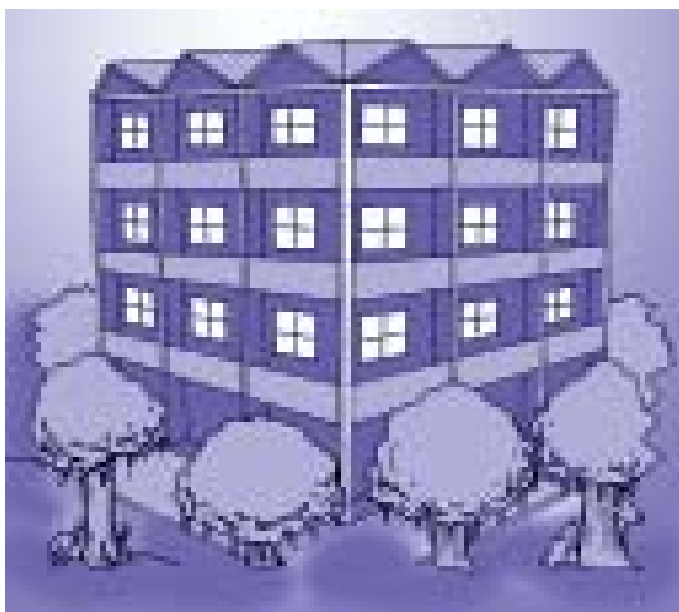
Gambar 4 Rumah susun

Praktik sewa dibalik sewa masih terjadi antara lain di Rusun Tambora I dan Rusun Tambora IV, Jakarta Barat, dan Rusun Penjaringan, Jakarta Utara.