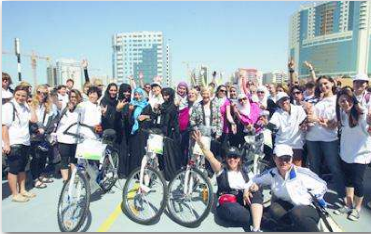
مُنحت درع «السلام»؛ تقديرًا لدور سموها الرائد والمتميز في تعزيز مبادئ السلام، ودعم المرأة والطفولة، والارتقاء بالمرأة إنسانياً ومعنوياً ومجتمعياً ورياضياً، واللجنة المنظمة لطواف النساء من أجل السلام العالمي السادس، دبي 2013م.