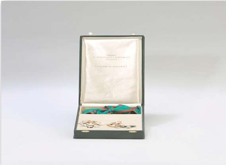
وسام الشرف بدرجة الاستحقاق من الجمهورية الإيطالية عام 2008؛ تقديرًا لدور سموها الفريد والأعمال العظيمة التي تقدمها لخدمة قضايا المرأة على الصُّعد كافة.