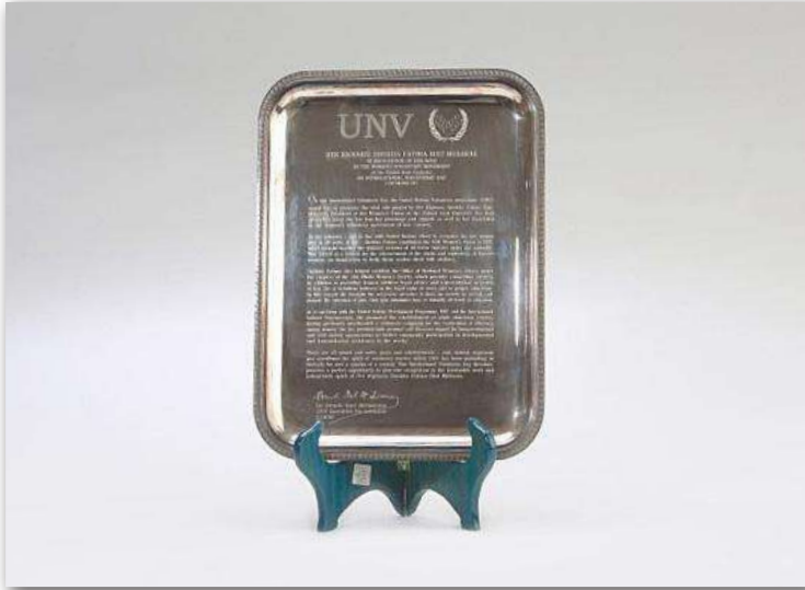
تكريم وجائزة من برنامج الأمم المتحدة للمتطوعين عام 1997م؛ لقيادة سموها الحكيمة ودعمها المتواصل والمستمر للعمل التطوعي.