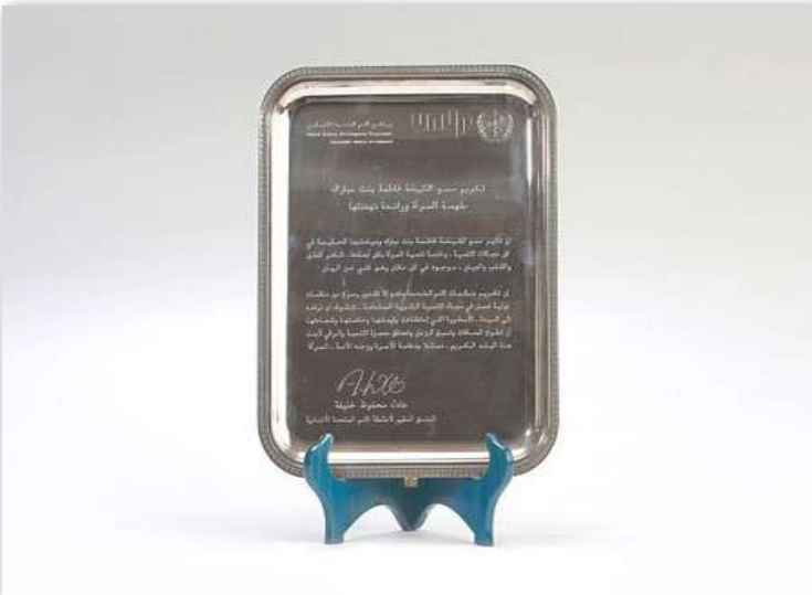
تكريم وجائزة من مكتب المنسق المقيم لأنشطة الأمم المتحدة الإنمائية بالدولة عام 1997م؛ لجهود سموها المتميزة في مجالات التنمية كافة، وخاصة في ما يتعلق بالمرأة.