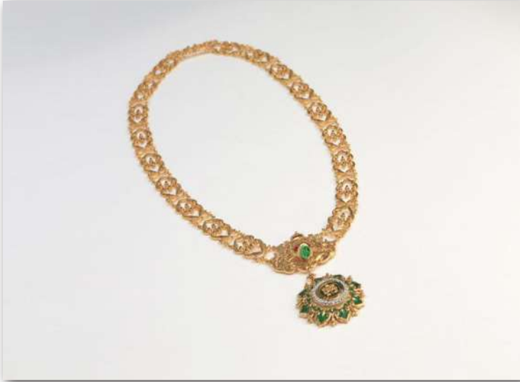
منح سمو الشيخة فاطمة «الوسام المحمدي» أعلى وسام في المغرب يمنح لرؤساء الدول، 2007م.