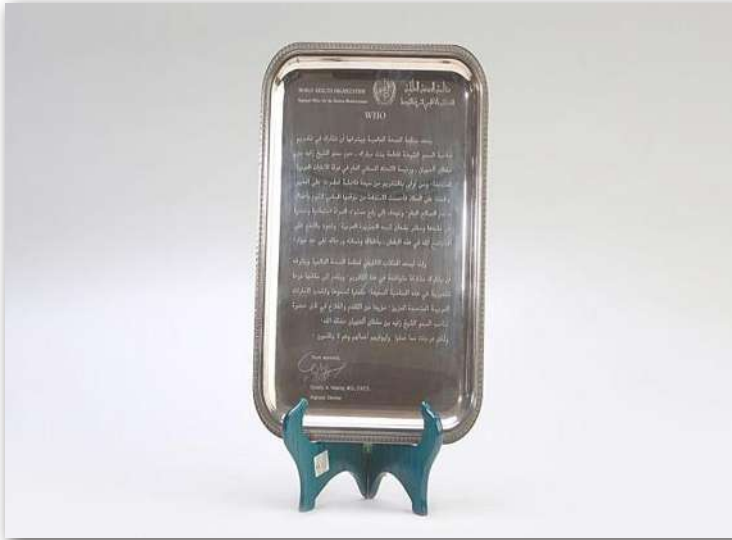
تكريم وجائزة من منظمة الصحة العالمية عام 1997م؛ تقديرًا لدور سموها في رفع مستوى المرأة اجتماعياً وصحياً في دولة الإمارات وسائر البلدان العربية.