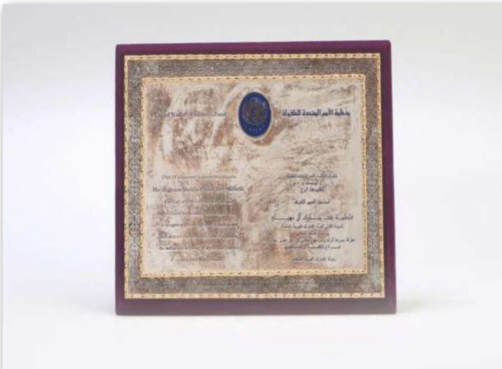
تكريم وجائزة من منظمة الأمم المتحدة للطفولة (اليونسيف) عام 1997م؛ تقديرًا لدور سموها الرائد في مجال تطوير أحوال المرأة والأطفال ورفاهيتهم.