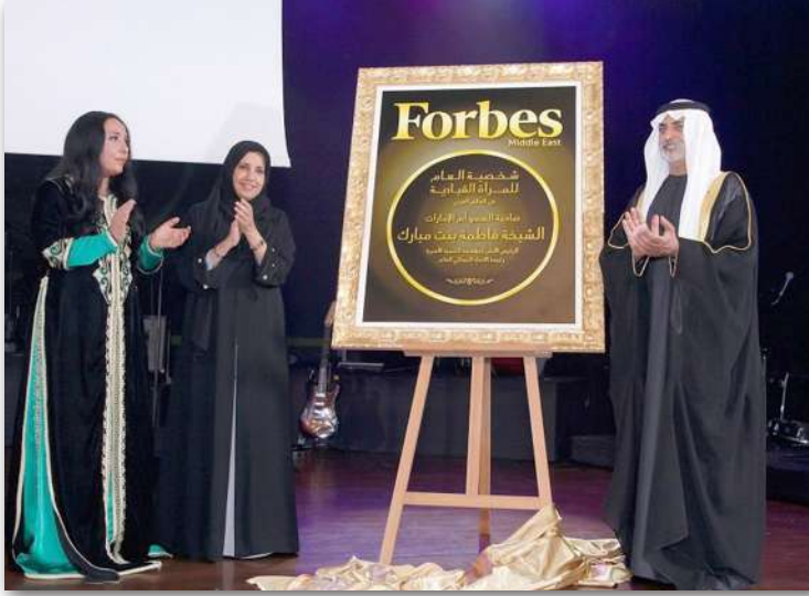
جائزة فوربس الشرق الأوسط عن شخصية العام للمرأة القيادية في العالم العربي لعام 2014م.