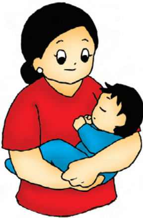
▲ gambar 5.1 ibu sedang menggendong anaknya

setiap orang pasti pernah mengalami sesuatu baik itu pengalaman yang menarik maupun pengalaman yang menakutkan semua itu akan menjadi kenangan bagi kita semua waktu kecil hingga besar kita dirawat oleh ibu semua adalah pengalaman kita