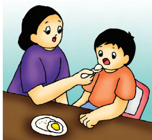
▲ gambar 5.2 ibu sedang menyuapi anaknya